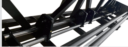
3 Farklı Folyo Basma İmkani