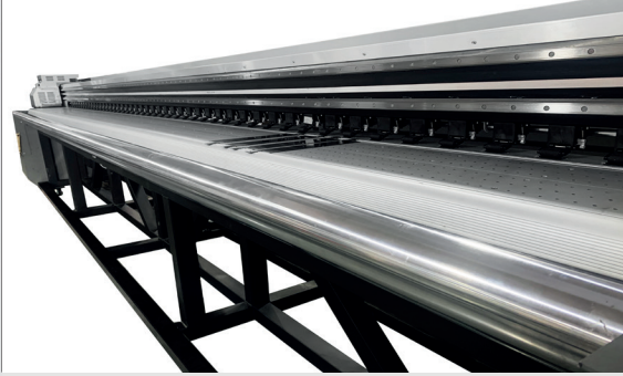
100mm Çapında Malzemeyi Yönlendiren Çelik Çubuk