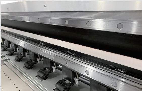
Geliştirilmiş Linear Ray Sistemi