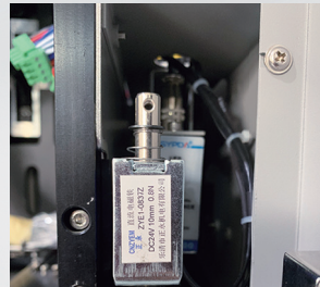
Malz. Yüksekliği Algılama Sensörü