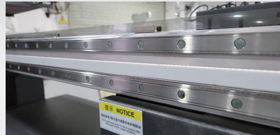
Çift Rinear Ray